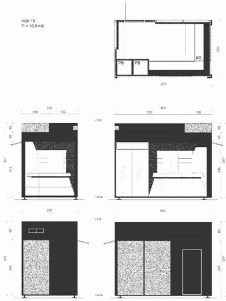
Grafički prilog br. 3 - Kiosk "NBK 15"